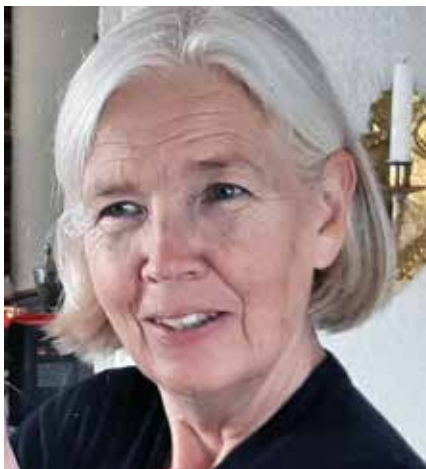
Dette blide fjeset blir å se i menigheten vår framover. Dette er vår nye prest!

Da barna begynte å bli store fant vi ut at vi ville gi dem anledning til å vok-