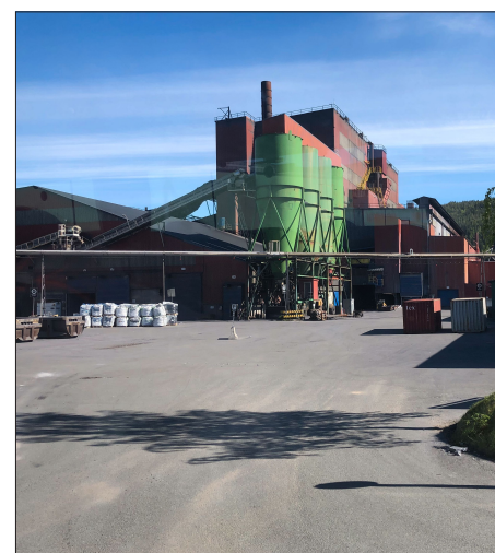
FAGFOLK: «Det hersker neppe noen tvil om at en stor del av de ledige stillingene må fylles av fagfolk fra utlandet, akkurat som i Mo i Rana» (bildet).