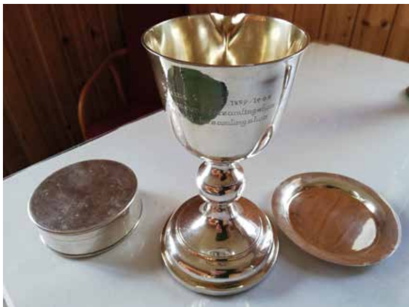
Steine kapell 1859 - 1905 Stamsund forsamlingshus 1905 - 1937 Brøstad forsamlingshus 1937

Ja, det er underlig hvor hendelser og ting kan knytte sammen og skape historie. Det aller fineste med dette kirkesølvet er at det har fått være med å formidle Guds velsignelse og nærvær både i to fiskevær i Lofoten og ei bygd i Dyrøy – helt fra 1859 – og ennå er det like skinnende, blankt og fint!