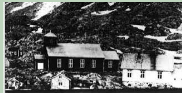
Steine kapell ca. 1890

Steine kapell lå på Steine i daværende Buksnes, nå Vestvågøy kommune i Nordland. Det var ei langkirke i tre med 500 plasser. Kapellet ble bygd i 1853 og innviet 6. mars 1854. Det blåste ned under en orkan 28. januar 1905. Folket på Steine ønsket å få reist et nytt kapell der, men det oppsto drakamp om stedsvalget mellom Steine og Stamsund. Da kapellet ble bygd, var Steine det største fiskeværet i den midtre delen av Lofoten. I løpet av årene som kapellet eksisterte hadde Stamsund vokst seg større enn Steine. Etter over 30 års diskusjon ble det nye gudshuset, Stamsund kirke, innviet i Stamsund i 1937.