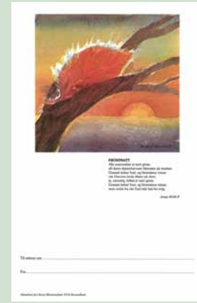
De fire forskjellige blomsterkortmotivene er «Blomsterkorset», «Livsdråpen», «Årstidene» og «Frostsatt», alle signert Svein Arild Berntsen fra Vangsvik.