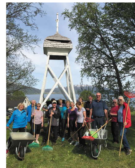
Fra en dugnad på Kastnes kirkegård for et par år siden. Ingenting å si på oppmøtet!

En stor takk til alle som bidrar, også de som bare møter opp og slik bidrar til fellesskapet!