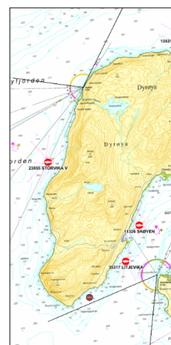
Figur 2 Hvit sektor

Området som ligger sør for Dyrøygomen/Hagenes er satt Fiskeformål (VFI) (se fig. 2). Bakgrunnen for dette er at området i fiskeridirektoratets kartbaser (kart.fiskeridir.no) er registrert som fiskeplass passive redskaper etter torsk i januar til desember. I tidligere plan var det en lokalitet til laks/ørret her og den er flyttet innover i Dyrøysundet utenfor Mikkalbostad.