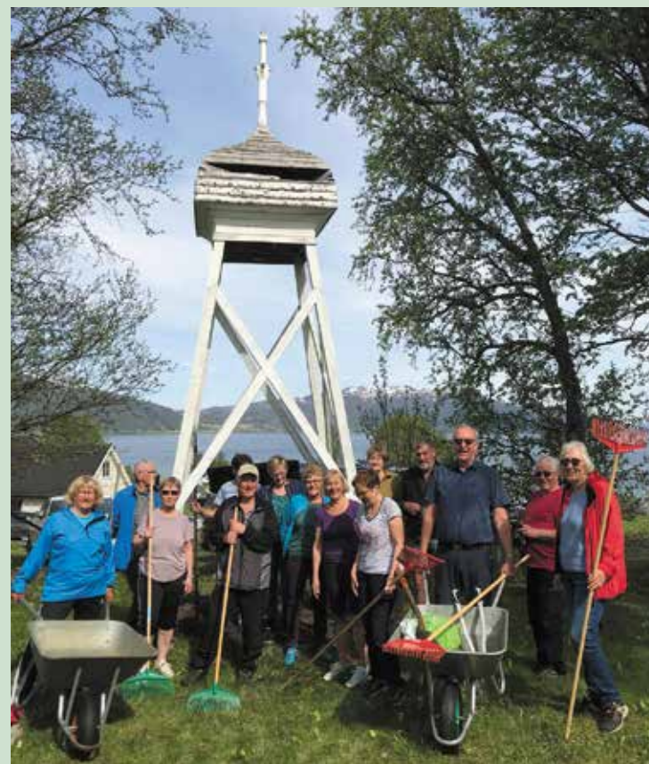
I vår var det dugnad ved den nedlagte kirkegården i Kastneshamn. Og som bildet viser er det ingenting å si på oppmøtet. Tårnet ser ut til å trenge litt vedlikehold for klokken i tårnet ramler ned. Siste begravelse på Kastnes var i 1998.