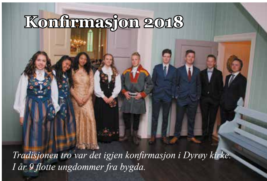
Tradisjonen tro var det igjen konfirmasjon i Dyrøy kirke. I år 9 flotte ungdommer fra bygda.

Et konfirmantår er til ende. 3. juni 2018 ble det konfirmert 9 flotte ungdommer fra Dyrøy, i Dyrøy kirke. De har vært en bra gjeng å følge!