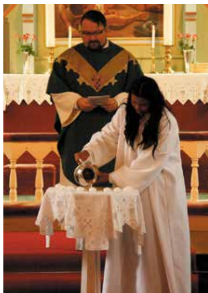
Natthanan heller vann i døpefonten til flytelysene.

går en rød tråd tilbake til dagen de aller fleste ikke husker: dåpsdagen.