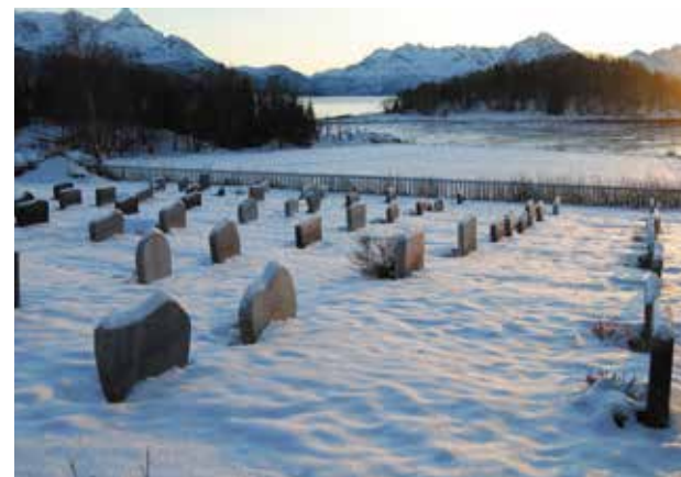
Nyere gravfelt er mer ensformig, men enklere å vedlikeholde.