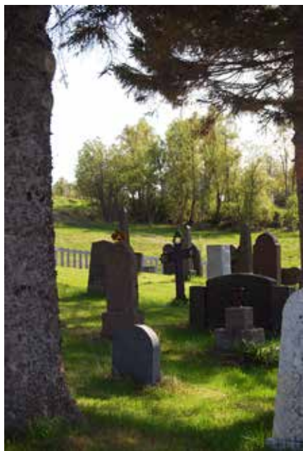
Eldre gravfelt er sjarmerende med sitt mangfold av gravmerker.

Vernearbeidet er vanskelig, for hvilke kriterier skal man legge til grunn? Kun de eldste og spesielle? Noen for hvert tiår eller stilperiode? Historiske hendel-