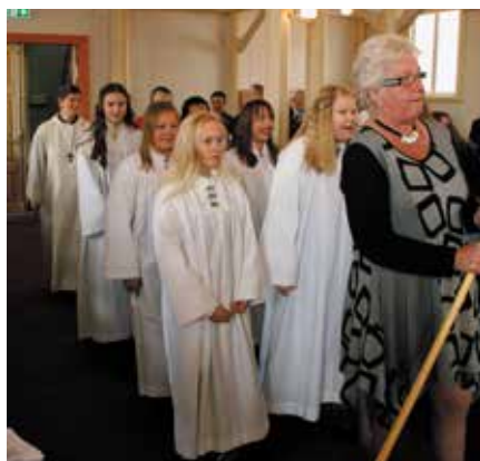
Da er vi i gang - konfirmanternes prosesjon.

Det var konfirmasjonsdag og Pinsedag og været var høvelig, men varmen som kom den kommende uka var ikke kommet. Alt lå til rette for en fin høytidsdag og 197 mennesker var samlet til en seremoni som samlet seg om fredstanker, fremtid og håp og forbønn for 6 unge mennesker med fremtiden foran seg. Det historiske øyeblikket er at det for konfirmanntåret 2016/2017 kun var jenter i kullet!