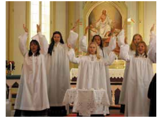
Som vanlig deltok konfirmanter med sang i gudstjenesten. - «Lord, I lift your name on high!»