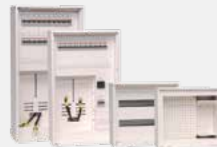
Skap for bolig

DEMAS as er en teknologi- og produksjonsbedrift som utvikler og leverer elektrotavler, ingeniørtjenester, automasjon – og styringsystemer. Bedriften består i dag av over 50 ansatte. Hovedkontoret ligger i Brøstadbotn, men bedriften har også avdeling på Hønefoss og kontorer i Harstad og i St. Petersburg/Russland.