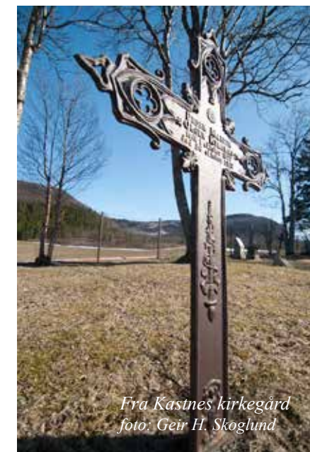
Fra Kastnes kirkegård

for Dyrøy Blomsterfonds styre, Kirsti Ottesen