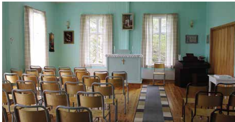
Kastnes bedehus var skole fra 1892 - 1955 før det ble overtatt som bedehus.

I skjøtet heter det at «Dyrøy Kommune skal ha rett til å leie huset til skole om det skulle bli nødvendig med skole på Kastnes. Videre skal huset kunne nyttes til de gudstjenester som blir holdt på Kastnes» .