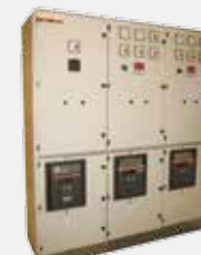
Tavler for skip

For mer informasjon gå inn på vår nettside: www.demas.no