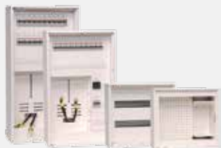
Skap for bolig

DEMAS as er en teknologi- og produksjonsbedrift som utvikler og leverer elektrotavler, ingeniør-tjenester, automasjon – og styringssystemer. Bedriften består i dag av ca. 50 ansatte. Hovedkontoret ligger i Brøstadbotn, men bedriften har avdeling på Hønefoss og kontor i Harstad.