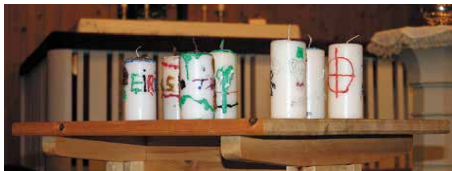
En tradisjon på «Lys Våken» er at ungene får fargelegge sine egne stearinlys.

I år valgte vi fokus på nettopp det å vandre i Jesu lys, da passet det godt med Vandre i Guds lys og den afrikanske evergreen, Siyahamba! Teksten for da-