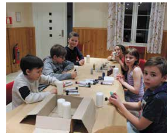
På lørdag var det bare å slippe løs kreativiteten. - «med blanke lys og fargestifter tel» ...

Søndag var det familiegudstjeneste i Brøstad kirke. Det var godt oppmøte av foreldre og familie og andre interesserte, takk for deltakelsen, og takk til de som ordna kaffe og kake, til en svært godt besøkt kirkekaffe.