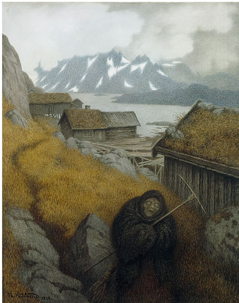
”Pesta farer landet rundt” Theodor Kittelsen 1904

Sist oppdatert: 7.7. 2008 Neste oppdatering: 7.7.2010